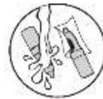
5. Hreinsa og þurrka.