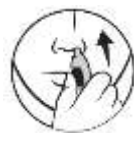
3. Settu stútinn inn í nösina