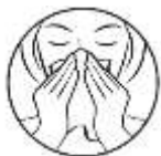
1. Snýttu þér