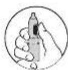
2. Þumalfingurinn á úðahnappinn