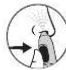
4. Þrýstu á hnappinn